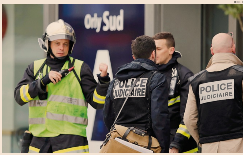
Allarme terrorismo. Le forze dell'ordine all'aeroporto di Orly dopo la sparatoria

Il clima elettorale in vista delle presidenziali del 23 aprile e del 7 maggio è incandescente di suo e già oggi, se i sondaggi non ingannano troppo, la maggioranza dei francesi ha abbandonato i due partiti tradizionali. Un'opinione pubblica senza bussola, o meglio senza più coordinate tradizionali, si affida soprattutto al Front National di Marine Le Pen, all'outsider della politica Emmanuel Macron e in parte alla sinistra radi-